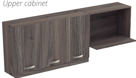
Mueble superior Upper cabinet